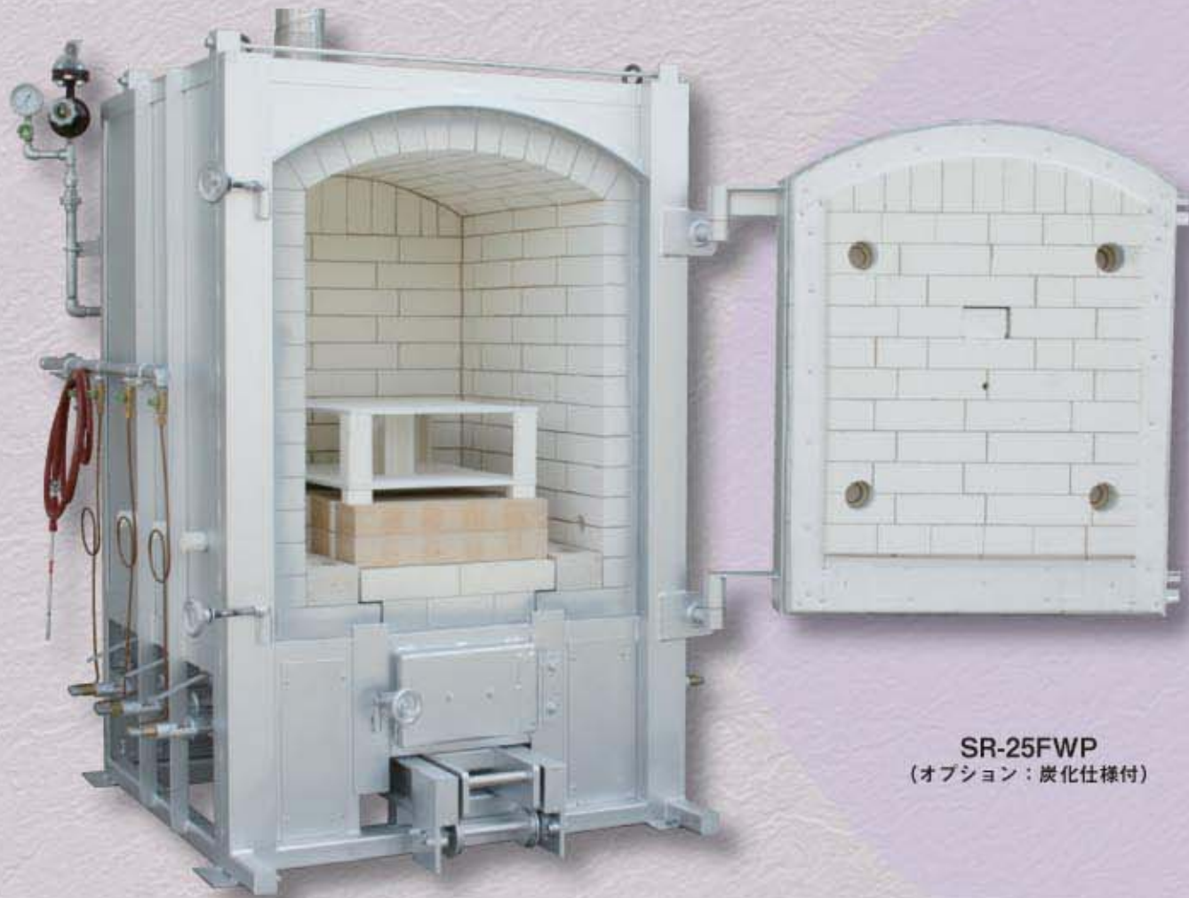
SR-25FWP (オプション：炭化仕様付)