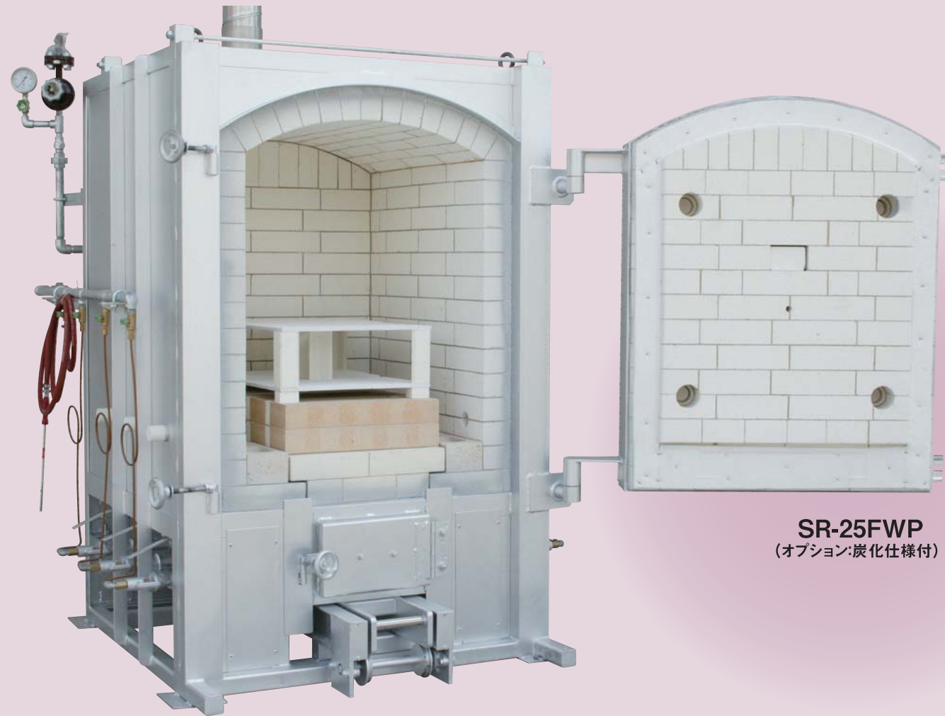
SR-25FWP (オプション:炭化仕様付)