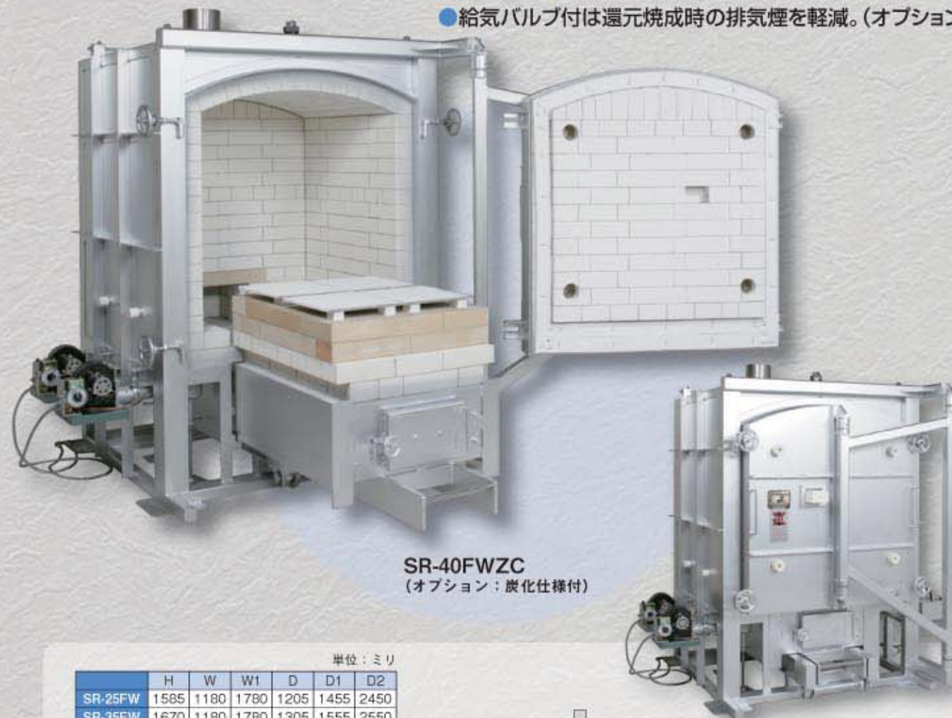
SR-40FWZC (オプション：炭化仕様付)