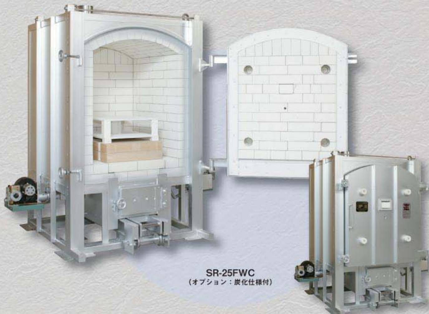
SR-25FWC (オプション：炭化仕様付)