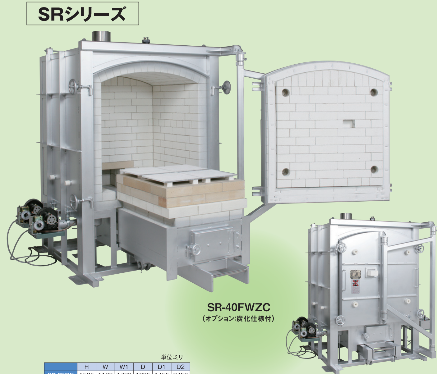
SR-40FWZC (オプション:炭化仕様付)