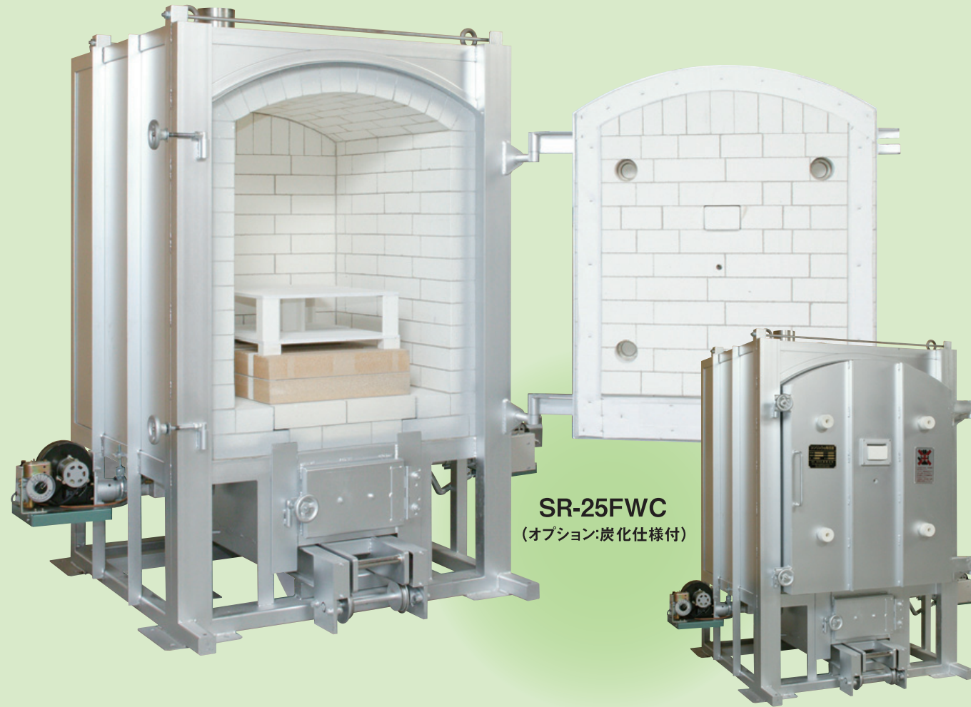
SR-25FWC (オプション:炭化仕様付)