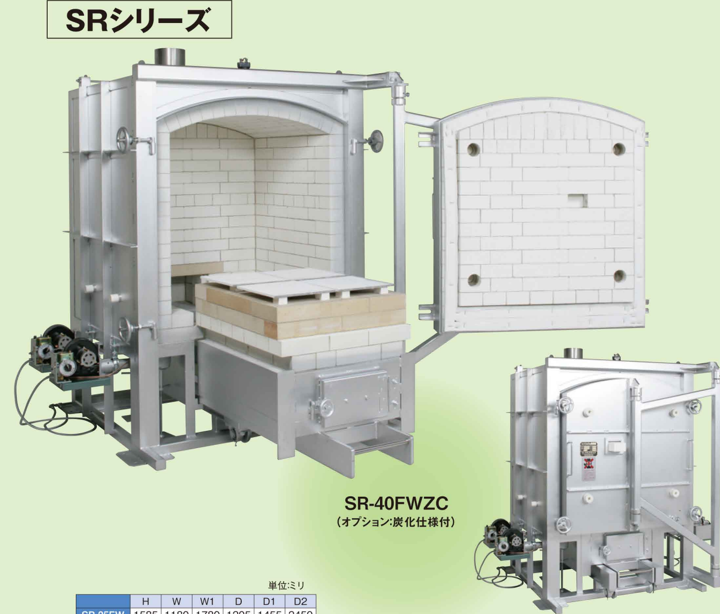
SR-40FWZC (オプション:炭化仕様付)