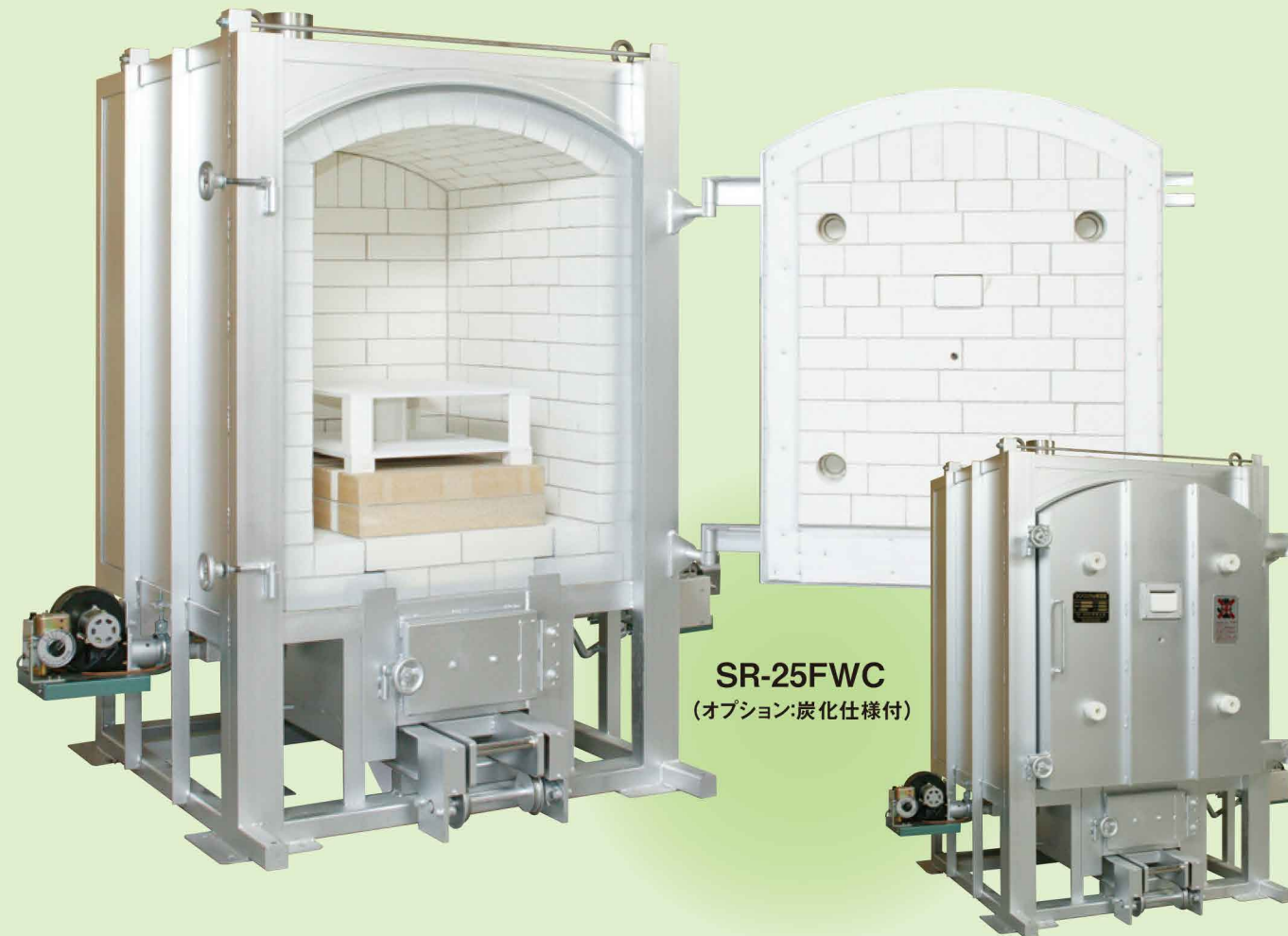
SR-25FWC (オプション:炭化仕様付)